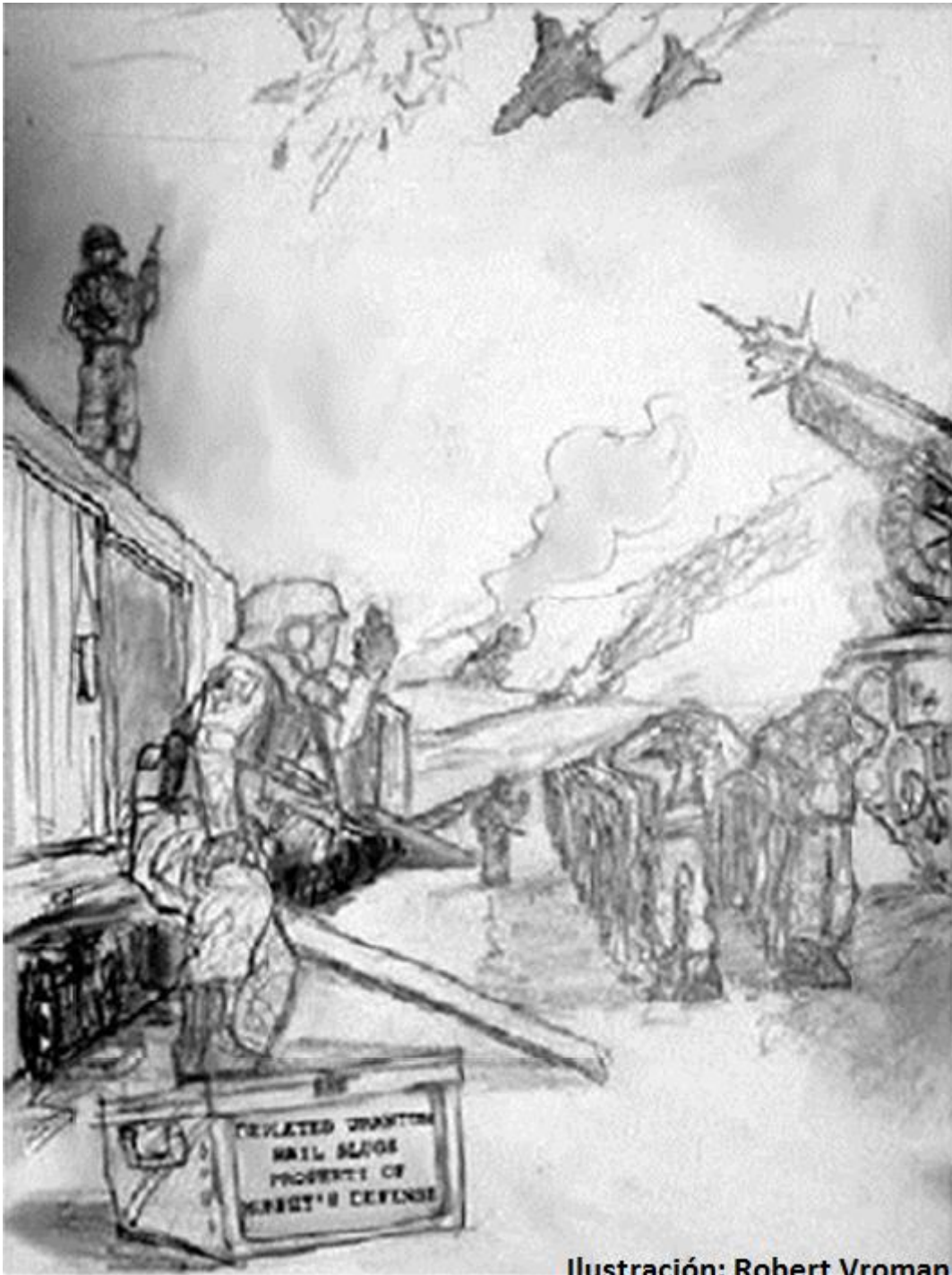
Ilustración: Robert Vroman